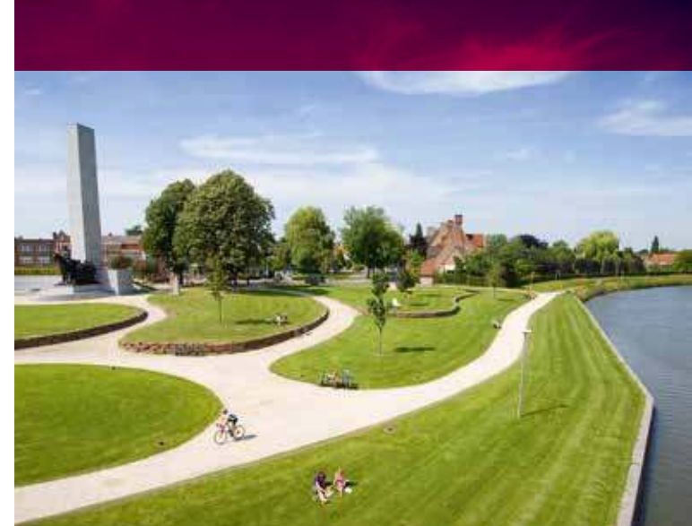
TOP 10 VAN KORTRIJK 2015

Kortrijk verrast van_werelderfgoed_tot_leieboorden